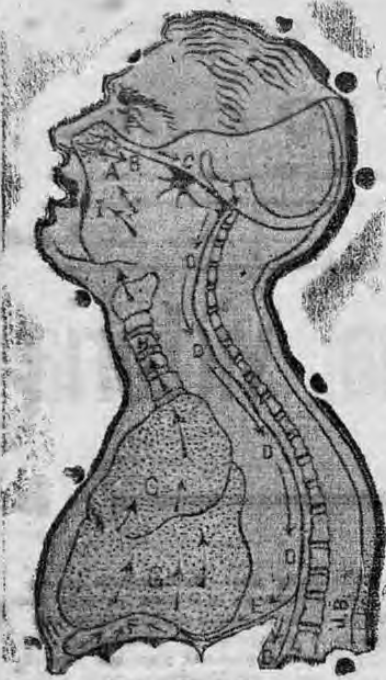
Diagrama del mecanismo del estornudo, que hace ver el curso del sistema muscular que propaga la infección "de gotera".

Los últimos descubrimientos sobre la "Influenza Española"