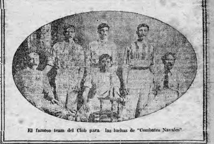
El famoso team del Club para las luchas de "Combates Navales"

venturas que es base de la salud física y moral de los jóvenes y estimulo importantísimo para el mejor desarrollo intelectual. Pero, desgraciadamente, no contamos hoy con tiempo y espacio suficientes para ese estudio; lo aplazamos para otra oportuna ocasión. Quiénes, en este minúsculo país, no conocen a esos valerosos esforzados del sport? Sus nombres figuran en las listas de honor de los centros deportivos de la República y en algunos salones de los mismos, sus retratos; y no son pocos, porque aquella instrucción física ha encontrado muchos admiradores y apoyadores en todas las clases sociales, especialmente entre los elementos intelectuales.