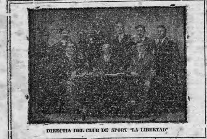
DIRECTIVA DEL CLUB DE SPORT "LA LIBERTAD"